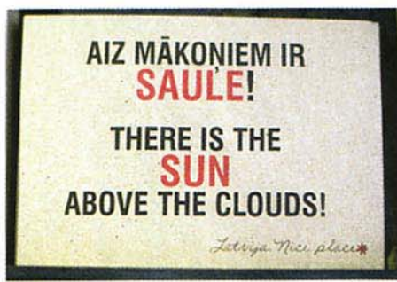
Recesijas tēma apspēlēta gan kartītēs, gan T-kreklu klāstā

Lai gan ideja par suvenīru nišu visus trīs